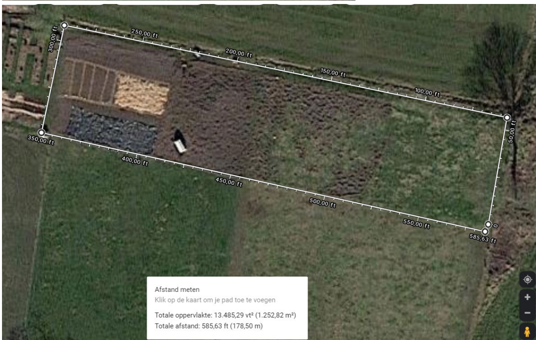
Figuur 1. de akker